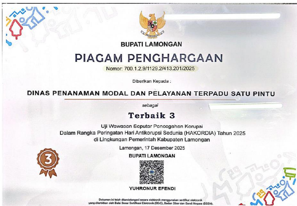
PENGHARGAAN DARI BUPATI LAMONGAN SEBAGAI TERBAIK 3 DALAM RANGKA PERINGATAN HARI ANTIKORUPSI SEDUNIA (HAKORDIA) TAHUN 2025