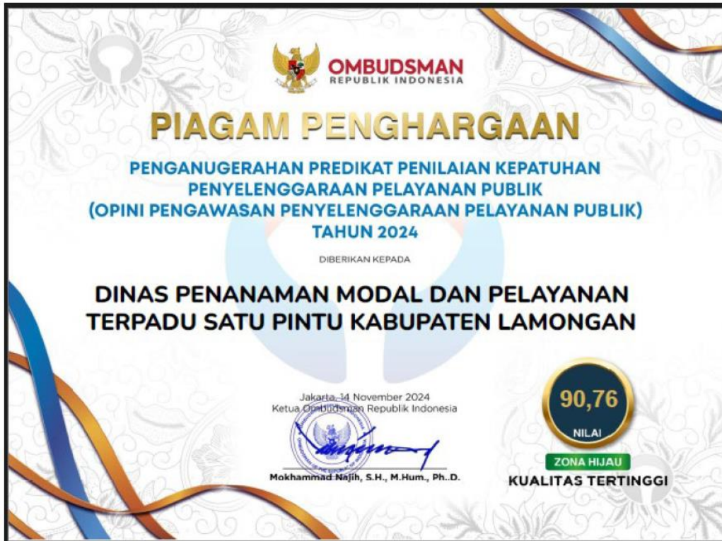
PIAGAM PENGHARGAAN DARI OMBUDSMAN MENDAPATKAN PELAYANAN PUBLIK KATEGORI 'ZONA HIJAU TAHUN 2024